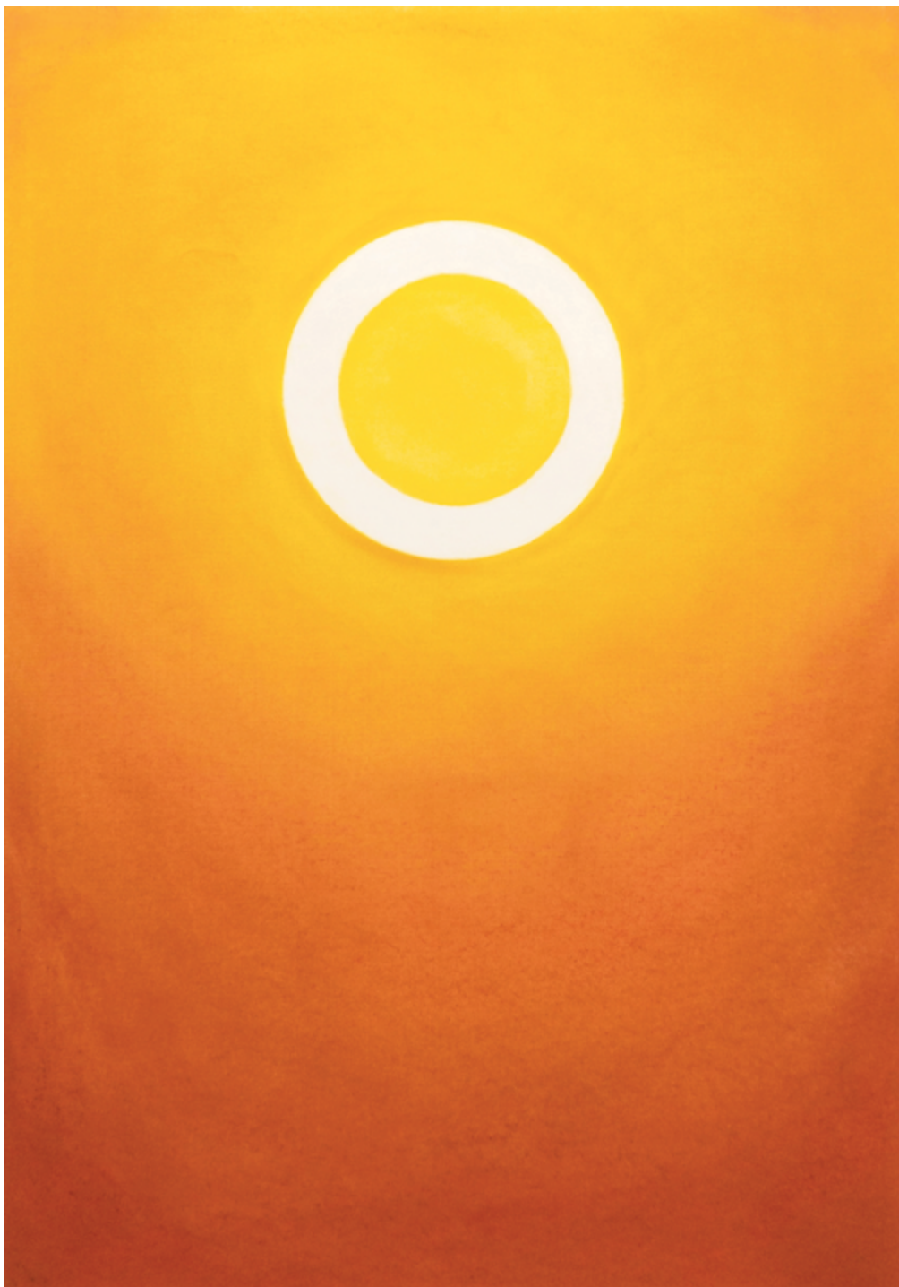
קארן דולב, ענבר (Amber), 2023, פסטל רך על נייר, 100x100 ס"מ