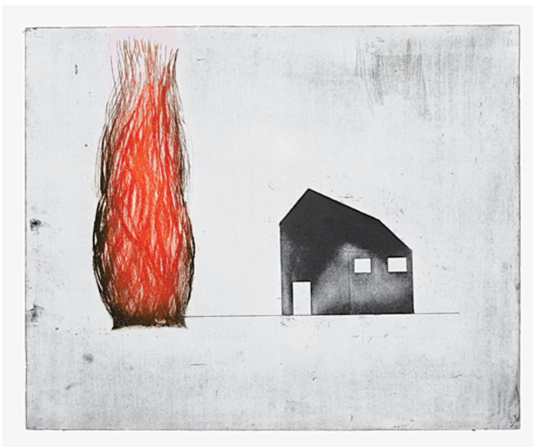
נלי אנסי, השמש צורבת את קירות הלב בזהב, 2007, תצריב, הודפס וראה אור על ידי סדנת ההדפס, ירושלים