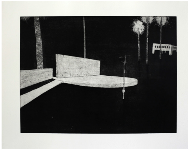
מור רימר, אמפי (מתוך הסדרה 'באישון ליל') 2020, תצריב אקוויטניטה

מסוימים להכניסם גם אל הגמיינשאפט – מאפשרת להם יתר נוחות במרחב.