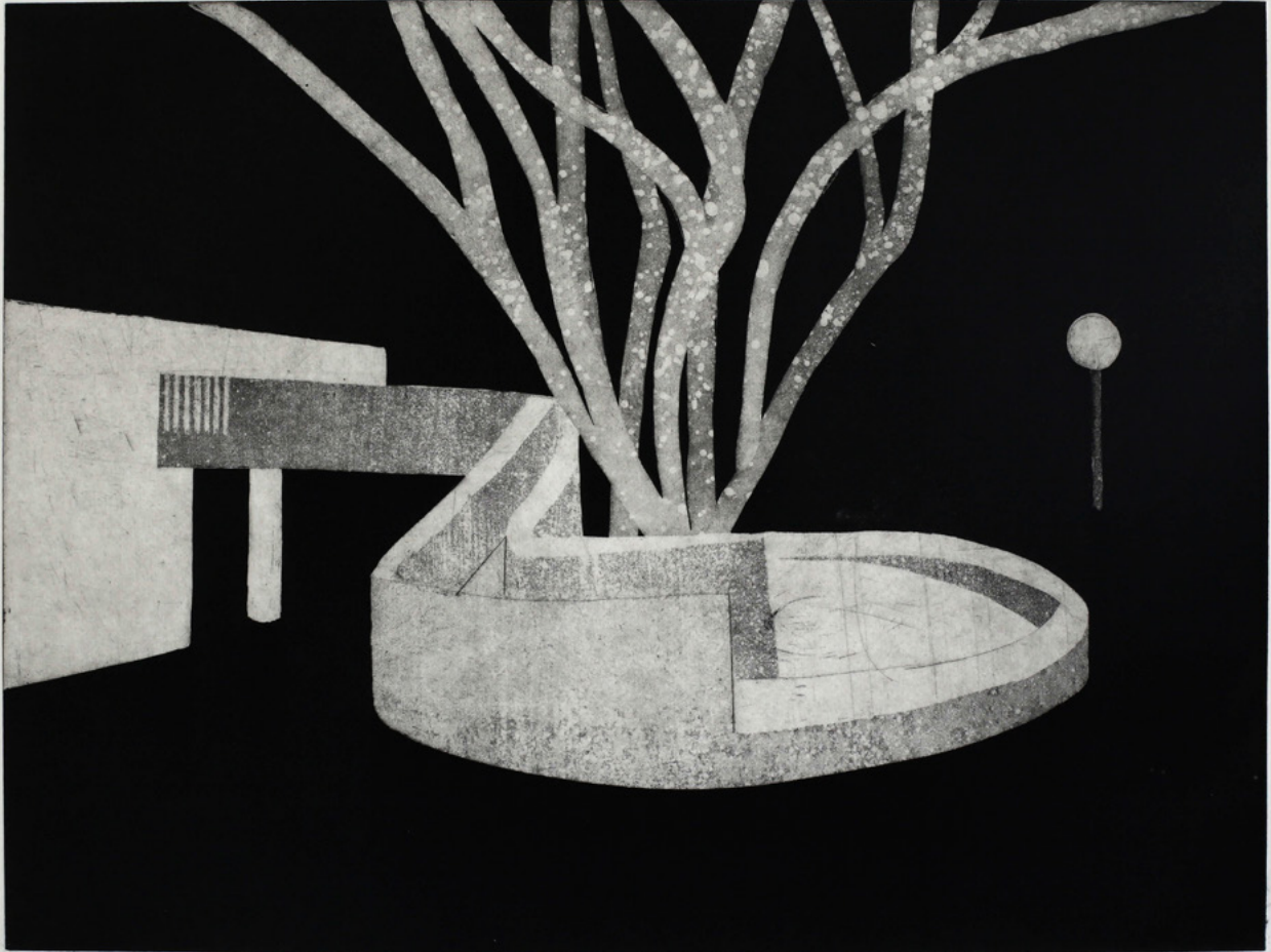
מור רימר, רמפה (מתוך הסדרה 'באישון ליל'), 2020, תצריב אקוויטינטה