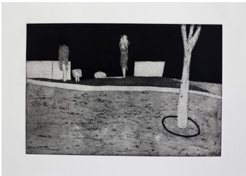
מור רימר, מישור קיבוצי (מתוך הסדרה 'באישון ליל'), 2020, תצריב אקוויטניטה

אולם לצד האתוס עצמו – שהוא חשוב ומעצב – ואיי הג' מיינשאפט הקיימים, עוד ועוד נתחים של החיים בישראל מתאפיינים בגולשאפט. מדובר בתהליך זוחל, וייתכן שבלתי נמנע. בהפיכה ממדינה קטנה הנמצאת בהקמה למדינה יציבה עם גידול אוכלוסין מתמיד. מערכות יחסים קרובות שהיו הב' סיס להקמתה של המדינה – בקיבוצים כמו בעיירות הפיתוח – הוחלפו באופן חלקי במערכות יחסים מנוכרות יותר. כך הוא הדבר בצורת המגורים – מבתי קרקע ובניינים קטנים, שבהם התושבים לכל הפחות מזהים אלה את אלה, למגדלי מגורים שבהם פעמים רבות אין היכרות כלל בין הדיירים. גם במקומות העבודה – בעוד בעבר היה מקובל לשכור עובדים על בסיס היכרות אישית, היוצרת את הנוחות ואת האינטימיות, כיום דבר זה נתפס כפסול, בלתי מקצועי ומפלה. חוק המכרזים, שעבר בשנת 1992 וקבע כי "מדינת ישראל, כל תאגיד ממשלתי, מועצה דתית, קופת חולים ומוסד להשכ' לה גבוהה, לא יתקשרו בחוזה לביצוע עסקה או עבודה, אלא באמצעות מכרז פומבי אשר נותן לכל אדם הזדמנות שווה להשתתף בו", הוא דוגמה להליך זה, הנובע מהתמקצעות ומי' תר ווגנות, אך גם משקף ריחוק מהגמיינשאפט, והשתרשות התפיסה החדשה, הגולשאפטית. ניתן להצביע על השינוי בכל דפוסי החיים: מקנייה יום-יומית במכולת השכונתית, שבה