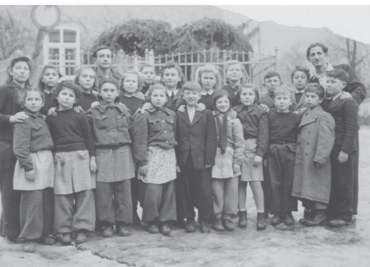
בית ספר לילדים משארית הפליטה, שאונשטיין, גרמניה. 1946

ובמקום שאין אנשים השתדל להיות איש (משנה מסכת אבות ב, ה)