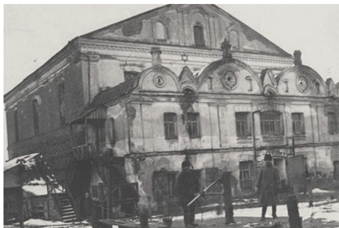
בית הכנסת הגדול בלודמיר, ווהלין, אוקראינה. צולם בין השנים 1921-1924.