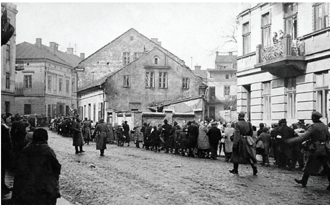
חיילים גרמנים מרכזים תושבים יהודים באושווינצ'ים, פולין. 1941