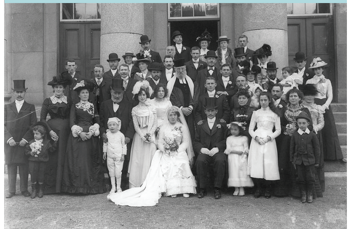
חתונה יהודית בבית המשפט בוטרפורד, אירלנד. ספטמבר 1901

המשתתפים מוזמנים להציג את עצמם בשמם ולומר את שמות הקהילות וארצות המוצא של משפחותיהם, ואת שמות ישוביהם עתה.