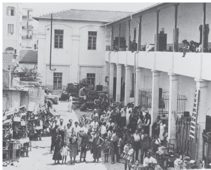
יהודים חסרי בית לאחר הפרעות בסלוניקי, יון. 1931.