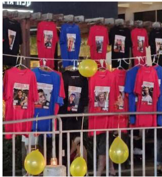
חולצות תלויות בחיפה