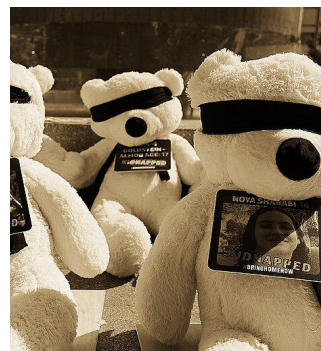
מיצג דובונים חטופים בת"א