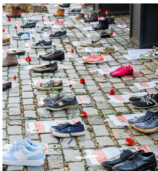
מיצג נעליים, בניין האו"ם בארה"ב