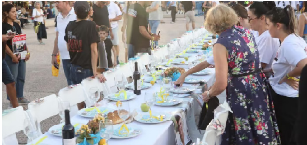
קבלת שבת של משפחות החטופים בת"א