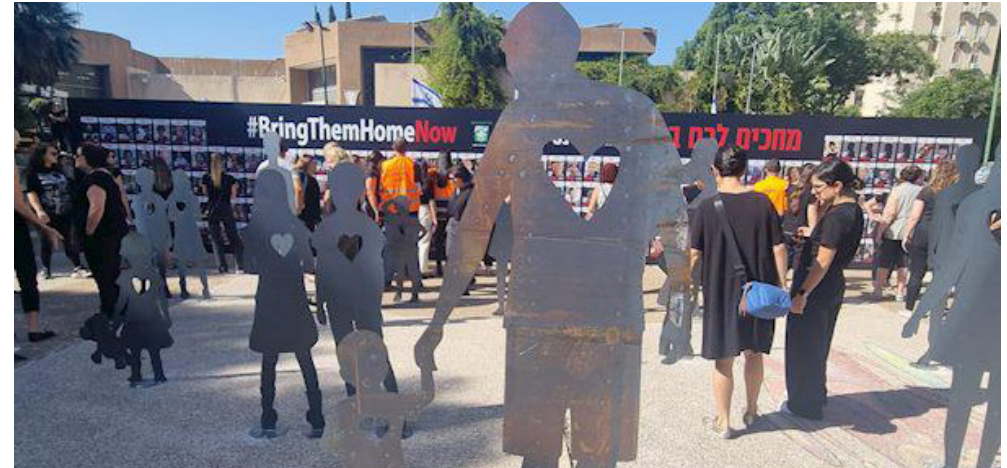
מיצג עיריית נס ציונה