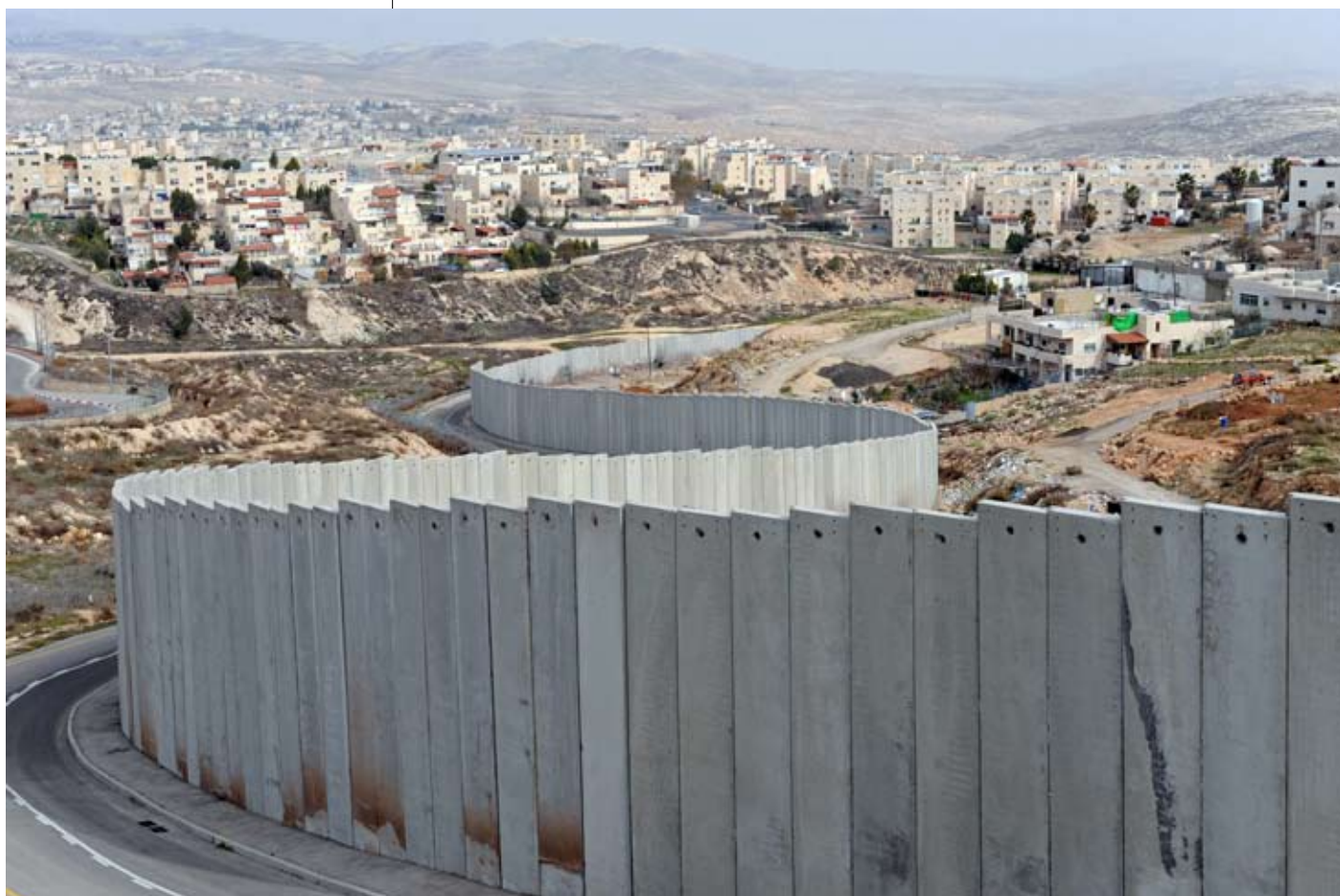
גדר ההפרדה' חוצה שכונות ערביות ויהודיות בירושלים